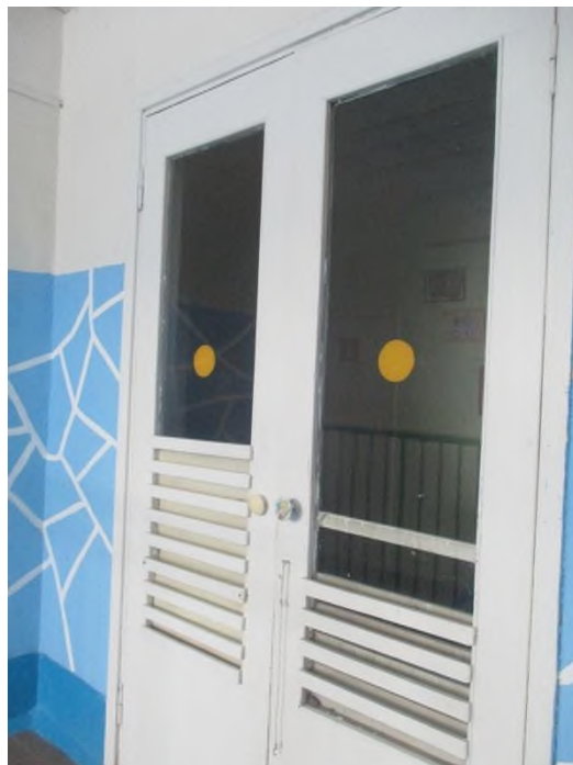
Контрастная предупредительная маркировка на стеклянной двери.