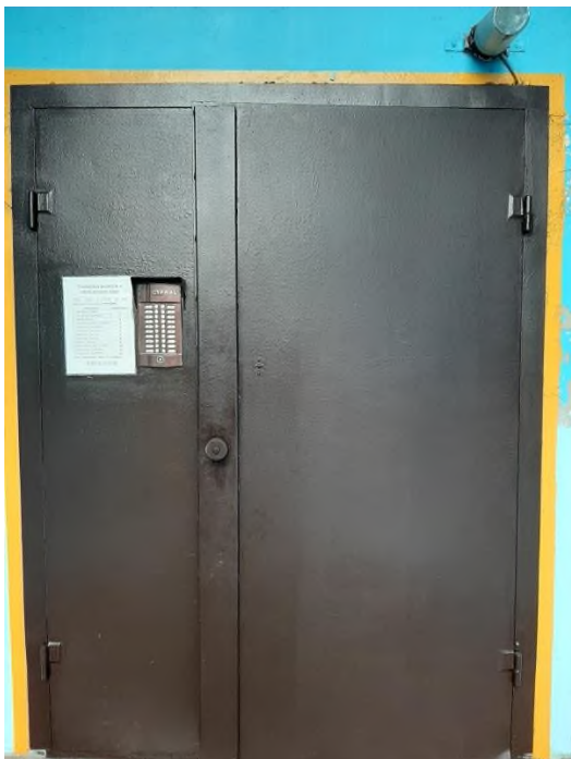
Контрастная предупредительная маркировка 100 мм дверного проема